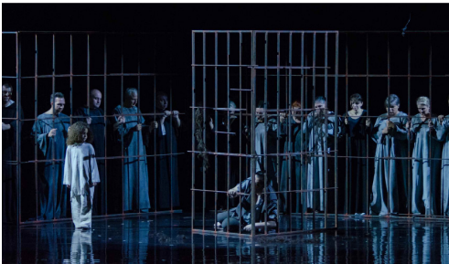
Închisoarea din Gaza