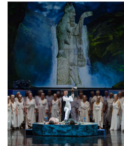
Masa de sacrificiu în templul lui Dagon